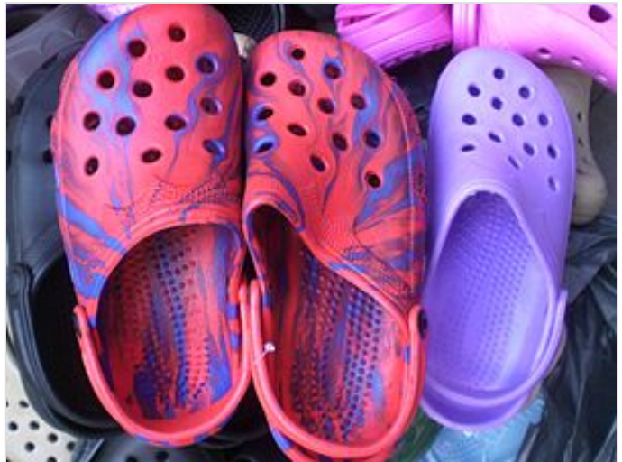
卡駱馳鞋 ， 塑膠製品