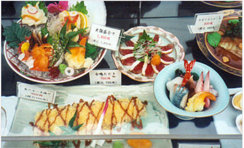
在日式餐廳外，常可見以塑膠製成的食物模型。