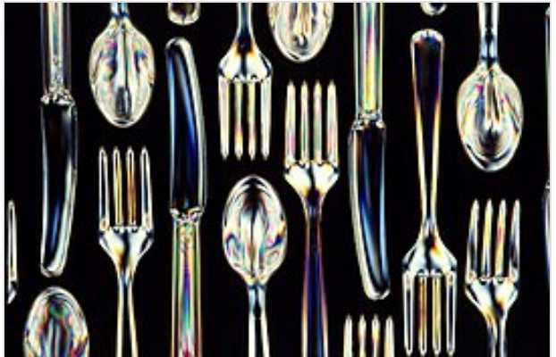
用可分解的澱粉塑膠製造的餐刀，叉子和湯匙。

食品包裝。以上的可分解塑膠由於成本問題，因此鮮有使用。而這種塑膠必需曝露於空氣的情況下才能分解，因此若被掩埋，仍然會導致固體廢物的問題。