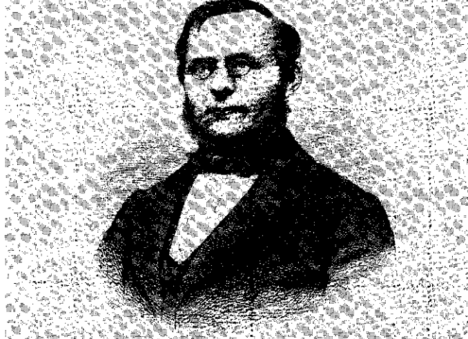
Wilhelm Wolff. (Gemeingut.)

Es ist, wenn ich mich des ersten März 1846. entsinne, das war ein Tag, an dem ich mich in der Stadt Leipzig befand. Ich war damals ein junger Mann, der sich mit der Philosophie beschäftigte. Ich war damals ein junger Mann, der sich mit der Philosophie beschäftigte. Ich war damals ein junger Mann, der sich mit der Philosophie beschäftigte.